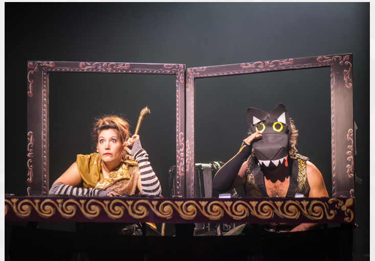
LES CONTES DÉFAITS, tournée 2021-2024

Musicalement, ce disque est à écouter plusieurs fois pour bien en saisir la subtilité des mélodies et rythmes : c'est un peu comme si Kate Bush, Queen, Jacques Higelin, Brigitte Fontaine, Bratsch et -M- organisaient un bœuf tous ensemble au bal des sorcières ! Tout au long du CD, on y croise de curieux personnages que nous connaissons pourtant bien : Baba Yaga, Hänsel et Gretel, Cendrillon, les Enfants perdus, le Joueur de flûte de Hamelin, etc. Une ambiance mystérieuse certes, fantastique forcément, mais toute en finesse et en drôlerie pour les enfants qui ne manqueront pas de sourire en écoutant Inspecteur Poucet, de s'étonner d'une Reine des neiges qui n'est pas la libérée, délivrée... Avec Me too, c'est un sujet bien plus sérieux qui est évoqué sans pathos, celui du respect entre hommes et femmes.